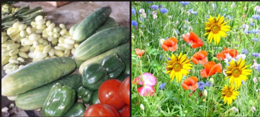
حماية النباتات والغابات من الأرض TERMITES CONTROL IN PLANTS & FORESTRY

سوبر باور إي سي مستحضرات ايناكارديم بيريكارب هيرل باور